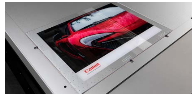
Soporte transparente rígido, con cama de blancos