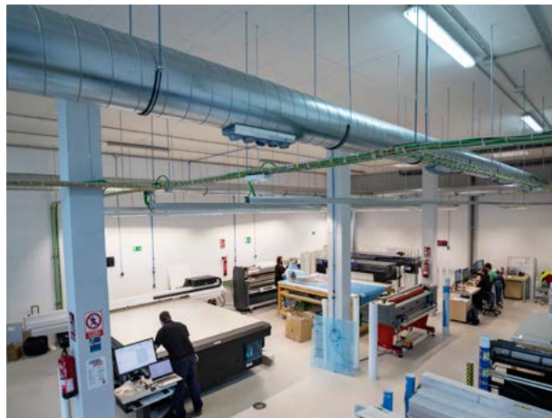
Vista parcial nave BBF®, planta baja

Hemos innovado para poder dar servicio a nuestros clientes, incluso cuando se producen importantes picos de trabajo.